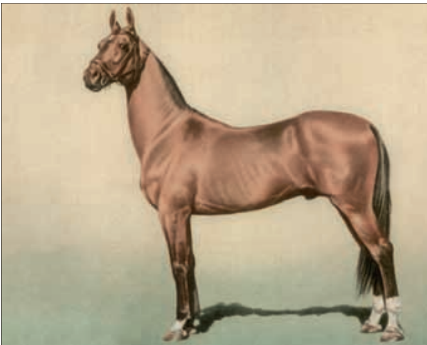
Achal-Teke-Hengst «Mele», geboren 1928 in Turkmenien.