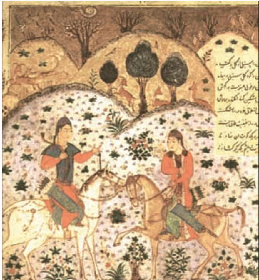
Zwei turkmenische Pferde um 1420, Miniatur «Husrau und Sirin auf der Jagd», Bai-sonqur-Handschrift. Seite 237, Staatliche Museen, Berlin.

nicht, was es ist, woher es kommt und wohin es geht.» Unter dem Enkel Dschingis Khans, Hulago (später, von 1261 bis 1265 Ilchan im von ihm eroberten Iran), war die Eroberung des Gebietes um 1250 durch die Mongolen abgeschlossen und 1258 auch Bagdad, Sitz des Abbasiden-Kalifats, völlig vernichtet, die gesamte Bevölkerung bis auf einige attraktive Frauen und Handwerker niedergemetzelt. Der nach Westen gerichtete Mongolensturm wurde zwar 1260 bei Ain Dschalut (nördlich Jerusalem) durch das Heer des ägyptischen Mamelukenherrschers Baibars I. (regierte 1260 bis 1277) zum Stehen gebracht, hatte aber eine völlige Vernichtung aller festen Plätze auch in den Oasen Turkestans beziehungsweise Turkmenistans zur Folge. Betroffen waren vor allem die bedeutenden Zentren für Handel und Landwirtschaft Merv (Ruinen nahe des heutigen Mary) und Tedzen; aber auch Urgentsch/Chiwa und Choresm sowie weitere Städte Turkestans wie Buchara, Taschkent, Kokand und Samarkand waren betroffen. «Was schön