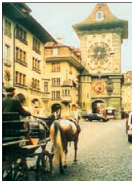
...und in der Kramgasse beim Zytglogge.

Impressum INFO 2007-1 Offizielles Verbandsorgan des Shagya-Araberverbandes der Schweiz. Erscheint vier oder fünf mal pro Jahr.