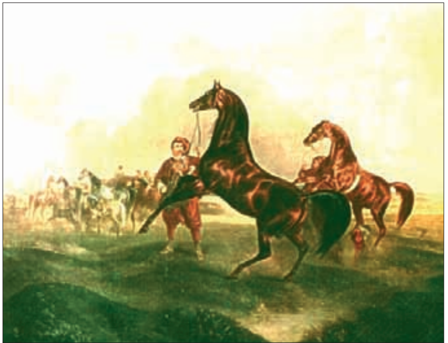
«Turanische Pferde», Gemälde von József Heicke (1811 bis 1861), Sammlung Miklós Jancovich, Budapest.

Seit Ende 1991 ist es wieder selbständig und eine Republik. Ihr Territorium liegt zwischen dem Kopet-Dag-Gebirge im Süden, dem Amudarja (Oxus) im Norden und dem Aral-See im Westen. Sie ist über 80 % von Wüste bedeckt. Nur die wenigen Oasen, Flüsse, Kanäle und eine besondere Bewässerungstechnik ermöglichen den heute etwa vier Millionen Bewohnern ein erträgliches Leben; Ackerbauern und Viehzüchter haben mit etwa 40 % einen hohen Be-