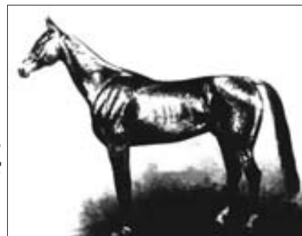
Achal-Teke-Hengst «Boynav», geboren 1885 in Turkmenien.

tier, wobei sie dabei gleichzeitig ihre Eignung zum Reiten unter Beweis stellen: Zur Siegesparade in Moskau am 24. Juni 1945 ritt Marschall Georgi Konstantinowitsch Schukow (1896 bis 1974) den Achal-Teke-Schimmelhengst «Arab 1930», den Vater des erfolgreichen Zuchthengstes und späteren Olympiasiegers im Dressurreiten «Absent 1952» (Rom 1960 Gold- und 1964 Tokio Bronzemedaille unter Sergej Filatow).