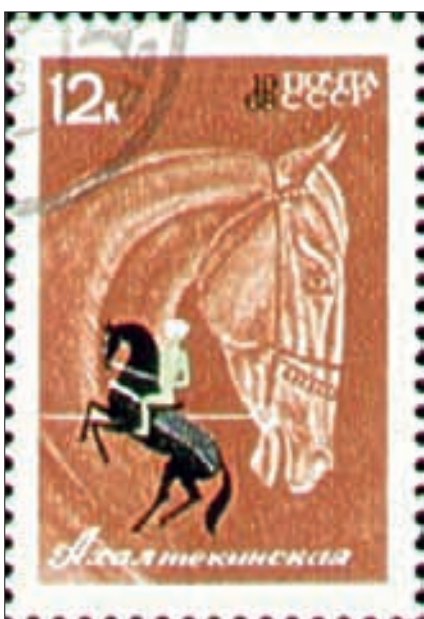
Achal-Teke-Hengst, Ausgabe der Post der UdSSR im Rahmen einer Pferdeserie 1968.

Vom 13. Jahrhundert an wurde auch diese für die Entwicklung der Zivilisation so sehr bedeutende Region Turkestan Opfer der Reiterheere von Dschingis Khan (geboren 1155, er starb am 18. August 1227 nach einem Reitunfall!) mit katastrophalen Folgen. Europa war völlig überrascht: Im Schutz des Rheins schrieb der Mönch Caesarius im Kloster Heisterbach 1222 «Im vergangenen Jahr brach ein Volk in die Reiche der Ruthener ein (Ostslawen, östlich des heutigen Ungarns und Polens), das einen ganzen Stamm vernichtete. Wir wissen von jenem Volk