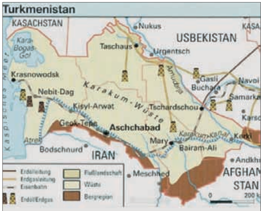
Aktuelle Karte der Republik Turkmenistan; das Land umfasst etwas mehr als 488 000 km 2 , hat rund 4 Millionen Einwohner (7,6 Einwohner pro km 2 ), davon etwa 75 % Turkmenen, 9 % Usbeken, 7 % Russen und 3 % Kasachen. Der Anteil der städtischen/ländlichen Bevölkerung beträgt 2006 etwa 50:50.

war, zerstörten sie, Kostbares beschmutzten sie, Rang, Geschlecht und Alter schändeten sie; Hilfe leistete niemand...»