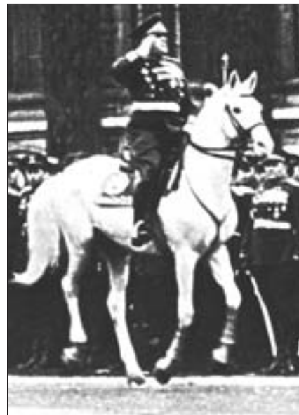
Achal-Teke-Hengst «Arab», geboren 1930 in Turkmenien, unter Marschall Georgi Konstantinowitsch Schukow anlässlich der Siegesparade am 24. Juni 1945 in Moskau.

Man war sich von jeher der Bedeutung der «Reinrassigkeit» des turkmenischen Pferdes bewusst und strebte sie an. Im Rahmen der Zuchtstätten innerhalb der Achal-Oase war das in den nun folgenden ruhigeren und stabileren Zeiten auch möglich. Konsequenterweise wurde nach der Erholung des Bestandes die erwähnte Verwendung von englischem Vollblut 1932 endgültig eingestellt und die Zucht seitdem nur noch reinrassig betrieben. Anfangs entschied dabei im Zweifelsfall das erwünschte und historisch gefestigte Exterieur des Pferdes über die Zulassung als Zucht-