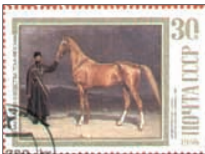
Achal-Teke-Hengst «Serdar», geboren 1882 in Turkmenien, Ausgabe der Post der UdSSR 1988, nach einem Gemälde von A. Villevalde, Museum für Pferdezucht, Moskau.

(Landwirtschaftsministerium) Sowjetrusslands verfahren. Die schweren Verluste der Vorjahre wurden dadurch allmählich ausgeglichen, und der Achal-Teke gehört heute zu einem der wertvollsten Schätze, die das Nomadentum der Menschheit hinterlassen hat.