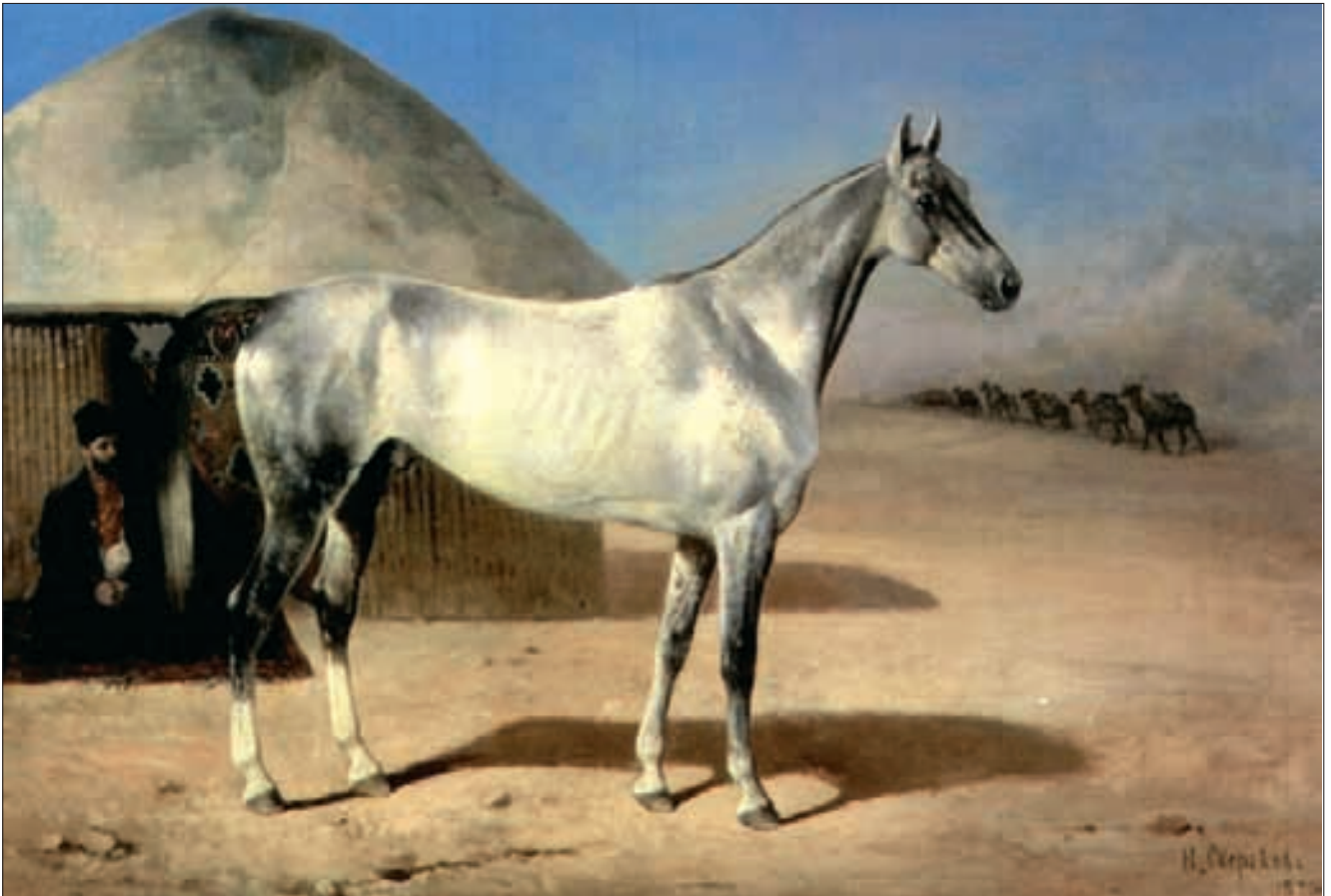
Achal-Teke-Hengst «Aad», geboren um 1860, Gemälde von N. E. Sverchkov 1870, Museum für Pferdezucht, Moskau.

dem damaligen Medien. Schon unter den Perserkönigen Kyros (der Grosse, regierte 559 bis 529 v. Chr.) und Darius I. (regierte 522 bis 486 v. Chr.) stand die Rasse in hoher Blüte. In den königlichen Gestüten sollen damals mehrere 100 000 Zuchtpferde gehalten worden sein. Die nach Hunderttausenden von Pferden zählenden Reiter- und Streitwagenheere Alexander III. (der Grosse, 356 bis 323 v. Chr.) und zuletzt Darius III. (regierte 336 bis 330 v. Chr.) waren mit turkmenischen Pferden ausgerüstet. Ihr Verbreitungsgebiet reichte über ganz Turkestan bis nach Mesopotamien, dem heutigen Irak. Ganz sicher ist auch, dass diese grosse Pferdegruppe an der Herausbildung der Arabischen Halbinsel beteiligt ist. Dieser Einfluss wurde auch dadurch begünstigt, dass turkmenische Stämme nach ihrer Islamisierung umfangreich im Dienste benachbarter Herrscherhäuser standen, so durchgehend bei den Bagdader Kali-