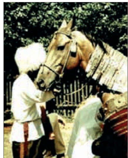
Achal-Teke-Hengst mit metalligglänzender Isabelfärbung und dem landestypischen Festschmuck aus Silber. Landwirtschaftsausstellung AGRA Markkleeburg bei Leipzig, Foto: Verfasser 1959.

asiatischen Tiefland zwischen den Niederungen des Kaspischen Meeres und dem kasachischen Hügelland. Turkestan umfasste die heutigen Republiken Kasachstan, Kirgistan, Tadschikistan, Turkmenistan und Usbekistan. Es besteht zu einem grossen Teil aus Wüsten und Halbwüsten, die von Oasen unterbrochen sind. Die Existenz des turanischen Pferdes als Vertreter eines im extrem trockenen Typ von alters her stehenden Tieres ist zuverlässig nachweisbar. Bedeutend dafür sind die Ausgrabungen nahe Fergana im Osten Usbekistans, die unter anderem Pferde aus der Zeit um 1000 v. Chr. zu Tage brachten. Von diesen wussten die Chinesen, dass sie Blut schwitzten und ein glänzendes Fell hatten; sie nannten sie «himmlische Pferde», um deren Besitz sie mit dem Baktrischen Reich mehrere Kriege führten. Als sehr aufschlussreich erwiesen sich auch die Ausgrabungen von Pasyryk vor 1929 und 1947 bis 1949 von Pferden in Grabkammern, die in den frostsicheren Zonen des Alanga-Hochtales (Altaigebirge) zwischen dem sechsten und ersten Jahrhundert v. Chr.