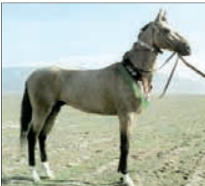
Achal-Teke-Hengst «Musur», geboren 1988 in Turkmenien.