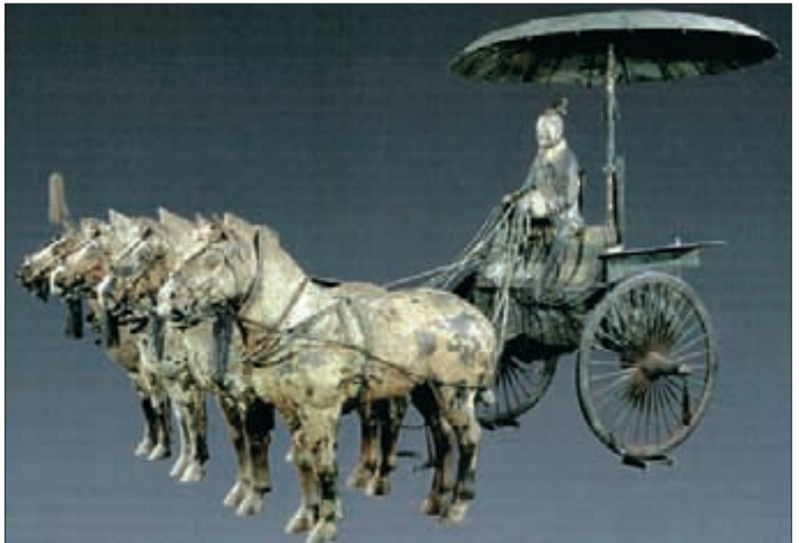
Vierspanner mit Pferden, die mit den baktrischen wenigstens verwandt waren (Huqu-Pferd, Nordwest-China), Bronze-Miniatur (50 % der Originalgrösse) eines chinesischen Hochwagens, aus einer Grube 1,5 km neben dem Grab von Kaiser Qin Shihuangdi (259 bis 210 v. Chr.), 1988 restauriert, Xi'an-Museum, Provinz Shaanxi, Ausstellung Markkleeberg bei Leipzig 2005.

völkerungsanteil. Es herrscht ein kontinentales Wüstenklima: Mit einer Niederschlagsmenge zwischen nur 75 und maximal 400 mm pro Jahr gehört das Gebiet zu den wasserärmsten der Erde, zwei Drittel des Landes erhalten weniger als 150 mm jährlich. Die Luftfeuchtigkeit ist extrem gering, die Tagestemperaturen