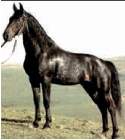
Kabardiner Hengst, im nördlichen Randgebiet von Turkmenien 1993 geboren. Diese Rasse ist in den Bergregionen des Kaukasus zu Hause und wird allseitig eingesetzt. Sie ist mit Turkmenischen Pferden und mit Karabachen eng verwandt, führt aber auch arabisches Blut. Die Pferde dieser Rasse sind anspruchslos, langlebig und fruchtbar und werden wegen ihrer Trittsicherheit sehr geschätzt.

gelenkseng mit weit vom Boden stehenden – Sprunggelenken. Die Hufe sind, wie bei allen Edelpferden klein, regelmässig, hart und haben oft wenig – ausgeprägte Trachten; – die Widerristhöhe liegt im Mittel bei Stuten bei 155 cm (150 bis 166 cm) und Hengsten bei 159 cm (154 bis 168 cm). – Die Körperlänge beträgt bei Stuten im Mittel 158 cm (153 bis 167 cm), bei Hengsten 160 cm (153 bis 167 cm). Das Mass für den Brustumfang ist zwar futterabhängig, bestätigt aber den allgemein sehr schlanken – Körperbau des Achal-Teke-Pferdes: Stuten erreichen 168 bis 192 cm (durchschnittlich 175,5 cm), Hengste 170 bis 188 cm (durchschnittlich 178,0 cm); – sein einzigartiger Gang. Er ist bei fast unbeweglichem Rücken gleitend und fliessend. Die Elastizität (Kadenz) ist hervorragend, der Raumgriff gross und der energische Antritt erfolgt deutlich aus der Hinterhand. So ist es kein Wunder, dass die Leistungen beispielsweise im Dressurreiten hoher Klasse von reinblütigen Achal-Teke-