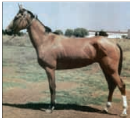
Achal-Teke-Hengst «Taze 2», geboren 1992 in Turkmenien.

die relative Isolation der Achal-Oase noch eine lokale Rasse. Ihre grosse Bedeutung liegt in ihrer unersetzlichen Quelle für die Erhaltung der Ursprünglichkeit, Qualität und Leistungsfähigkeit des turkmenischen Pferdes schlechthin. Die Ursache hierfür ist in ihrer genetischen Konsolidierung durch jahrtausendelange Auslese auf maximale Anpassungsfähigkeit an die herrschenden Klimaverhältnisse und kargen Haltungsbedingungen bei zugleich erbarmungslos geforderter Leistung, vorwiegend unter dem Reiter, zu suchen. Dieser war ja fast immer ein Krieger – allein was letzteres bedeutet, können wir heute kaum mehr ermessen.