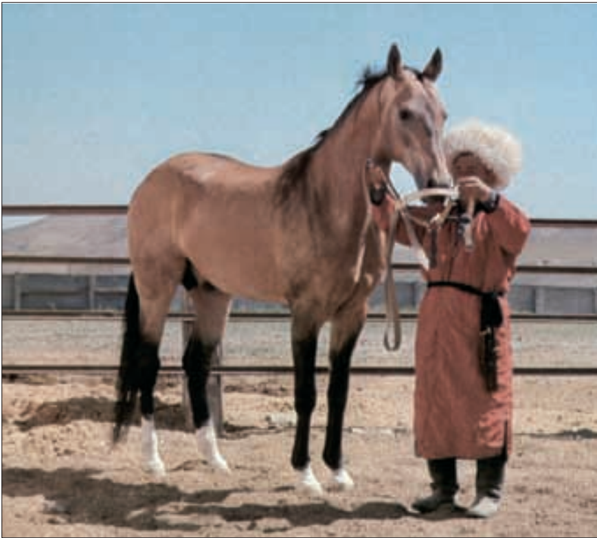
Achal-Teke-Hengst «Julduz», geboren 1962 in Turkmenien.