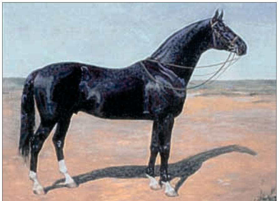
Achal-Teke-Rapphengst Absent, geboren 1952, von Arab, geboren 1930. Olympiasieger im Dressurreiten in Rom 1960 und Bronzegewinner in Tokio 1964 unter Sergej Filatow.

Das ist auch ein Beweis dafür, dass das Überleben dieser wertvollen und seltenen Rasse gesichert und damit dieses Denkmal des Nomadentums erhalten werden kann.