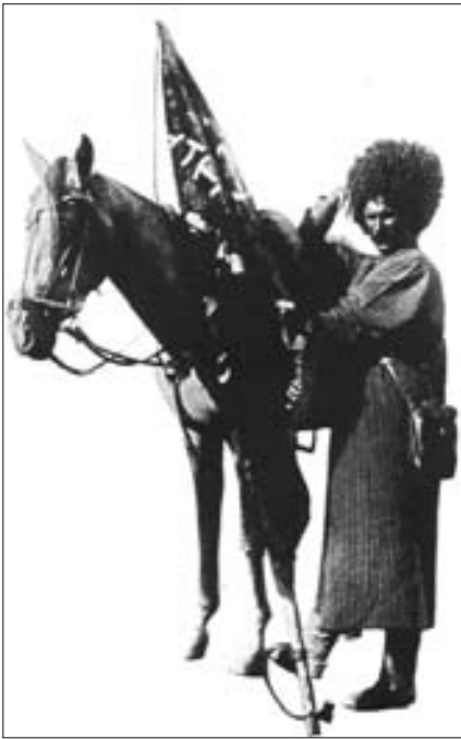
Turkmenischer Reiter mit seinem Pferd nach dem historischen Ritt über 4300 km von Aschchabad in 84 Tagen durch die Karakum-Wüste nach Moskau 1935.

nicht, was es ist, woher es kommt und wohin es geht.» Unter dem Enkel Dschingis Khans, Hulago (später, von 1261 bis 1265 Ilchan im von ihm eroberten Iran), war die Eroberung des Gebietes um 1250 durch die Mongolen abgeschlossen und 1258 auch Bagdad, Sitz des Abbasiden-Kalifats, völlig vernichtet, die gesamte Bevölkerung bis auf einige attraktive Frauen und Handwerker niedergemetzelt. Der nach Westen gerichtete Mongolensturm wurde zwar 1260 bei Ain Dschalut (nördlich Jerusalem) durch das Heer des ägyptischen Mamelukenherrschers Baibars I. (regierte 1260 bis 1277) zum Stehen gebracht, hatte aber eine völlige Vernichtung aller festen Plätze auch in den Oasen Turkestans beziehungsweise Turkmenistans zur Folge. Betroffen waren vor allem die bedeutenden Zentren für Handel und Landwirtschaft Merv (Ruinen nahe des heutigen Mary) und Tedzen; aber auch Urgentsch/Chiwa und Choresm sowie weitere Städte Turkestans wie Buchara, Taschkent, Kokand und Samarkand waren betroffen. «Was schön