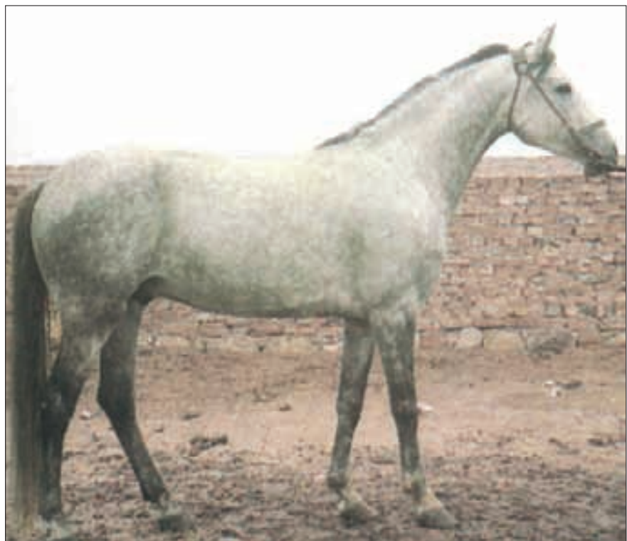
Iomud-Hengst, in Turkmenien 1993 geboren. Es handelt sich um eine Reitpferderasse, die eng mit dem Turkmenischen Pferd verwandt ist und ursprünglich im transkaspischen Bereich von Arabischen Pferden beeinflusst wurde. Es ist ein hartes, ausdauerndes Pferd, das infolge seines guten Gangvermögens in Schritt und Galopp als Kavalleriepferd besonders geeignet war. Heute wird es als Reit- und als Gespannpferd verwendet.

Pferd ist sehr zuverlässig, geschickt und schnell sowie – völlig anspruchslos an Unterkunft und Ernährung und «nicht totzukriegen», ausserdem sehr schön; – der Kopf hat gerades Profil, ist fein ziseliert, trägt grosse, ausdrucksvolle Augen, die Nüstern sind weit, – Ohrmuscheln stehen weit auseinander. Man sieht in der Regel einen hochangesetzten, langen, flachen Hals mit – hoher Kopfhaltung (etwa 45° zum Hals). Dadurch liegt das Maul bei manchen Tieren höher als der Widerrist; – der Körper hat kein bisschen Fett zu viel, ist also trocken, röhrenförmig und durch einen hohen, ausgeprägten – Widerrist gekennzeichnet, der in eine lange, schräge Schulter ausläuft. Der Rücken ist lang, die Rippen sind flach, – die Lenden schmal. Die Extremitäten sind generell sehnig und muskulös. Vorder- und Hinterbeine stehen meist eng, vorn gerade mit langem Oberarm, hinten oft sprung-