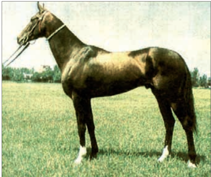
Achal-Teke-Hengst «Asad», geboren 1964 Turkmenien.

asiatischen Tiefland zwischen den Niederungen des Kaspischen Meeres und dem kasachischen Hügelland. Turkestan umfasste die heutigen Republiken Kasachstan, Kirgistan, Tadschikistan, Turkmenistan und Usbekistan. Es besteht zu einem grossen Teil aus Wüsten und Halbwüsten, die von Oasen unterbrochen sind. Die Existenz des turanischen Pferdes als Vertreter eines im extrem trockenen Typ von alters her stehenden Tieres ist zuverlässig nachweisbar. Bedeutend dafür sind die Ausgrabungen nahe Fergana im Osten Usbekistans, die unter anderem Pferde aus der Zeit um 1000 v. Chr. zu Tage brachten. Von diesen wussten die Chinesen, dass sie Blut schwitzten und ein glänzendes Fell hatten; sie nannten sie «himmlische Pferde», um deren Besitz sie mit dem Baktrischen Reich mehrere Kriege führten. Als sehr aufschlussreich erwiesen sich auch die Ausgrabungen von Pasyryk vor 1929 und 1947 bis 1949 von Pferden in Grabkammern, die in den frostsicheren Zonen des Alanga-Hochtales (Altaigebirge) zwischen dem sechsten und ersten Jahrhundert v. Chr.