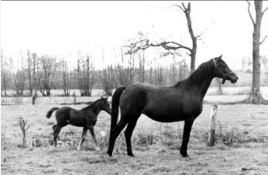
O' Bajan XIII-12, Bábolna (D), 1964, Bábolna, von O' Bajan XIII, aus der 198 Kemir II mit dem Hengstfohlen Bartok, 1971, D-Hamburg, von Gazal VII.